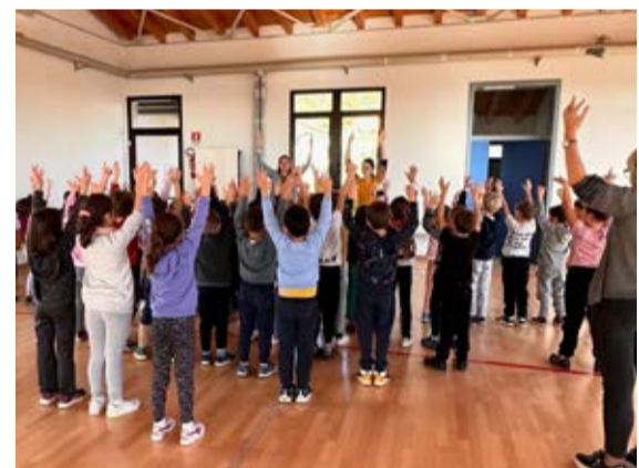
Alcuni momenti dalla Settimana dell'Inclusione

È sempre attivo il servizio di trasporto sociale , possibile grazie alle sponsorizzazioni delle aziende locali. Un dato: negli ultimi due anni il mezzo dedicato al trasporto sociale ha percorso circa 700 viaggi, una media circa di 2 viaggi al giorno.