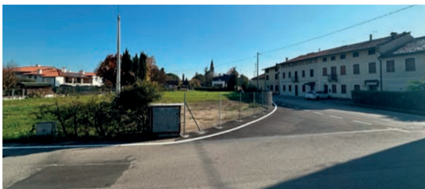
Riqualificazione incrocio Villarspa

Questa limitazione non rappresenta solamente un vincolo amministrativo, ma è per noi un'importante responsabilità: ci ricorda che il suolo è una risorsa preziosa e non rinnovabile. Ogni trasformazione del territorio deve essere quindi valutata e giustificata da un criterio di beneficio pubblico. L'obiettivo è assicurare che le nuove urbanizzazioni e gli interventi apportino un valore aggiunto alla comunità, migliorando la qualità della vita dei cittadini e rispettando il nostro patrimonio ambientale. Questo approccio non solo rispetta il valore della proprietà privata, ma assicura che lo sviluppo territoriale sia in armonia con l'interesse della collettività e che preservi il patrimonio per le generazioni future garantendo uno sviluppo equilibrato e sostenibile.