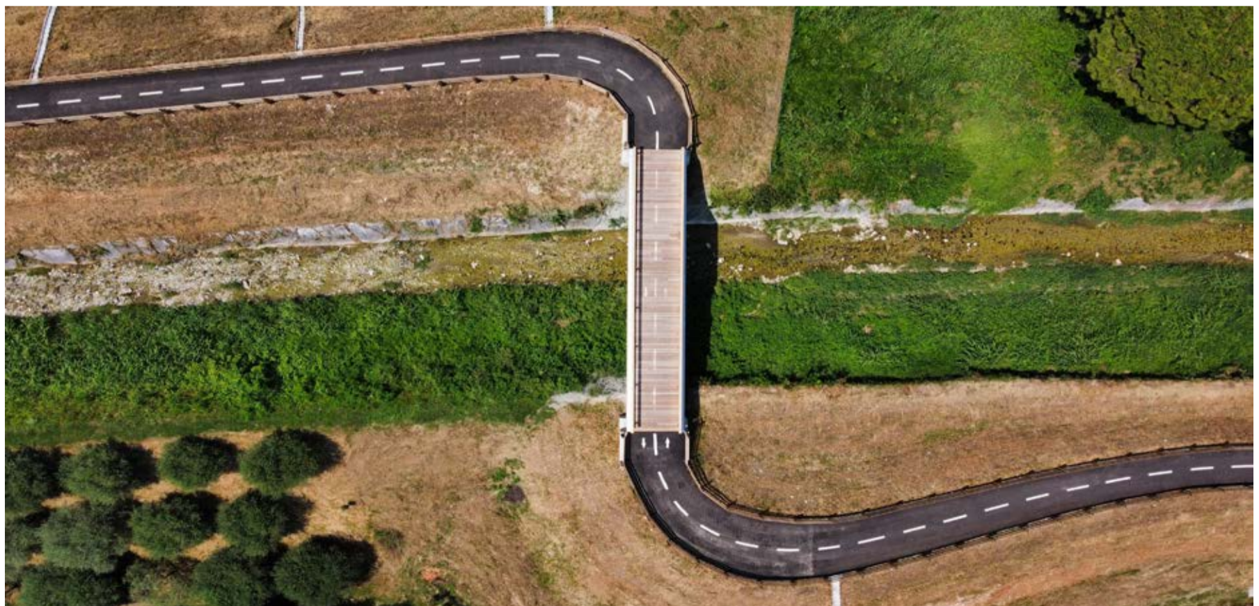
Nuova pista ciclopedonale Mason-Villaraspa

La gestione del servizio rifiuti passerà all'ente Consiglio Bacino Brenta per i Rifiuti a partire dal 2026 perché in una recente assemblea si è concordato di prorogare il passaggio di un anno. Questa è una buona notizia perché sfrutteremo il 2025 per accompagnare al meglio la cittadinanza al subentro definitivo tenendo come caposaldo il mantenimento dell'eccellente servizio porta a porta nel nostro territorio.